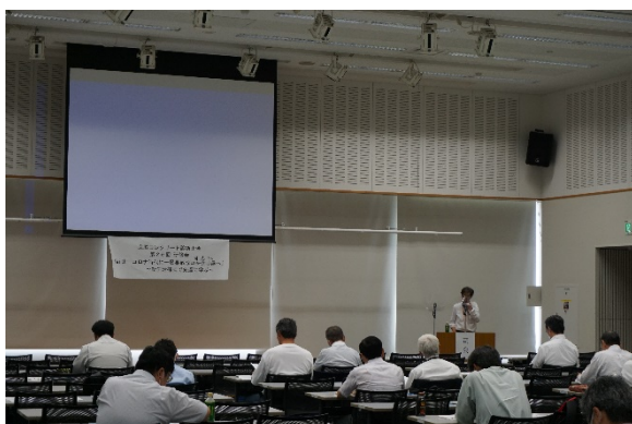
▲衣川事務局長による研修会の注意事項説明