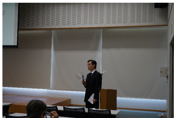
▲高井会長による開会の挨拶