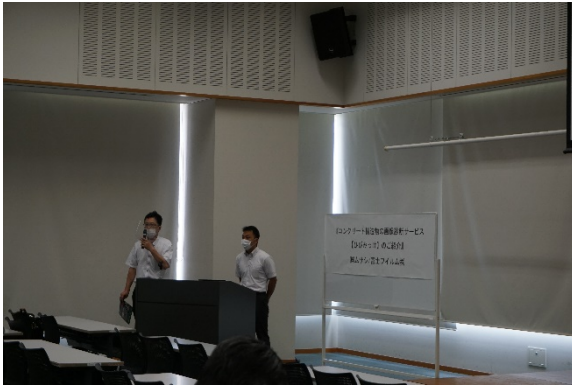
▲メーカー各社の講演 (株)ムサシ/富士フィルム様