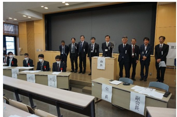
役員紹介 新役員全員